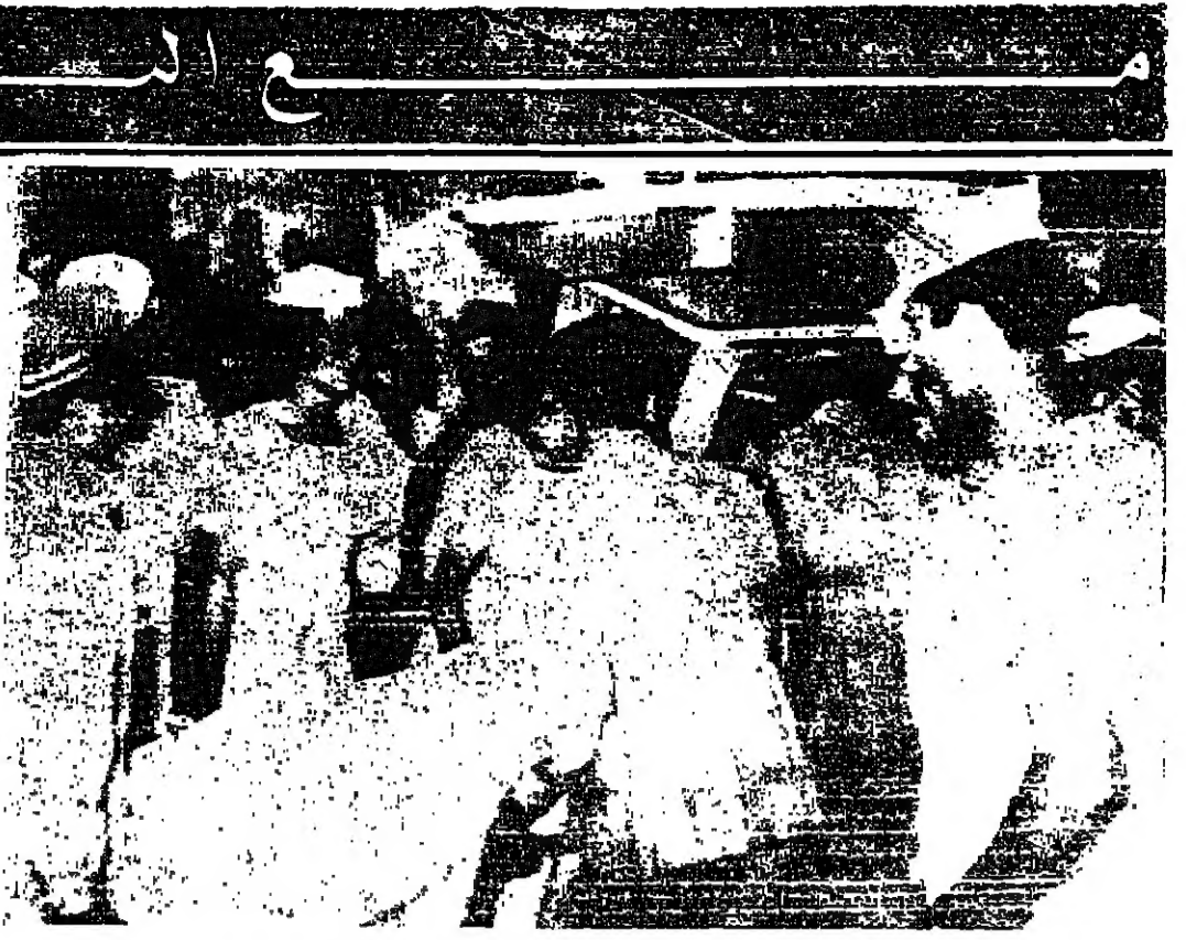
لوزق تابع سلاح البحرية البريطاني لدى وصوله الى الاسكندرية حاملاً هبة انتشلها من حطام الطائرة المصرية...